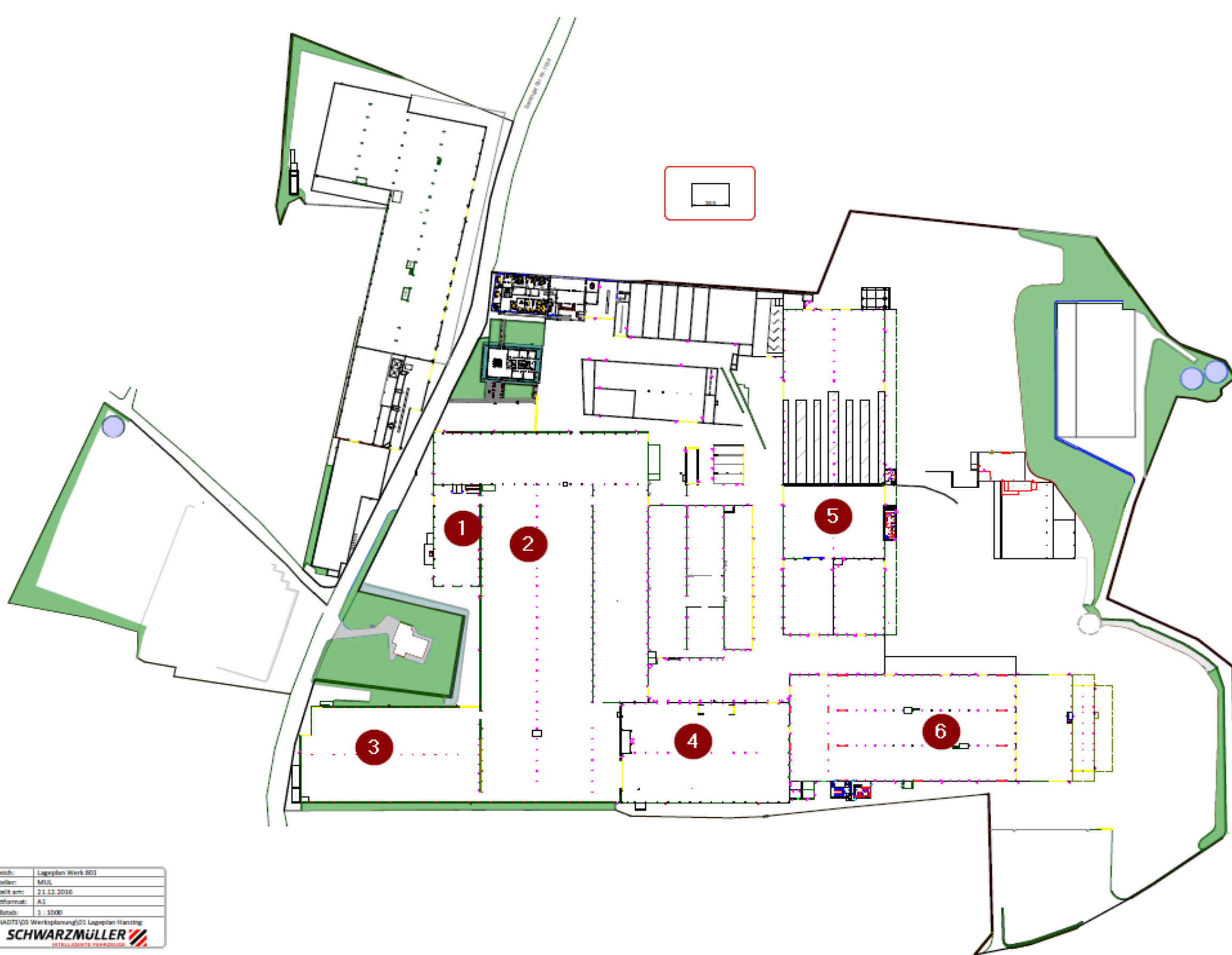
Grundriss der Produktion